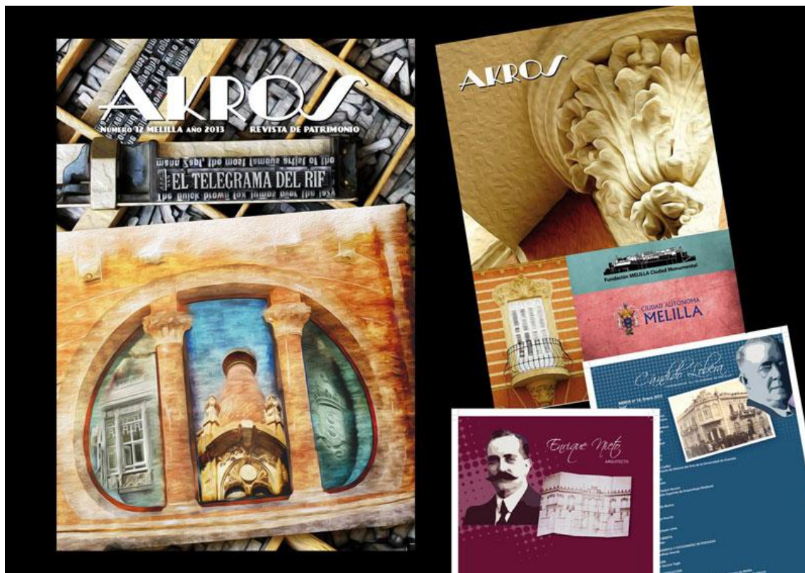
Ilustración 05. Revista Akros nº 12 (2013). Composición de portadas (Carlos Santiago, 2013).