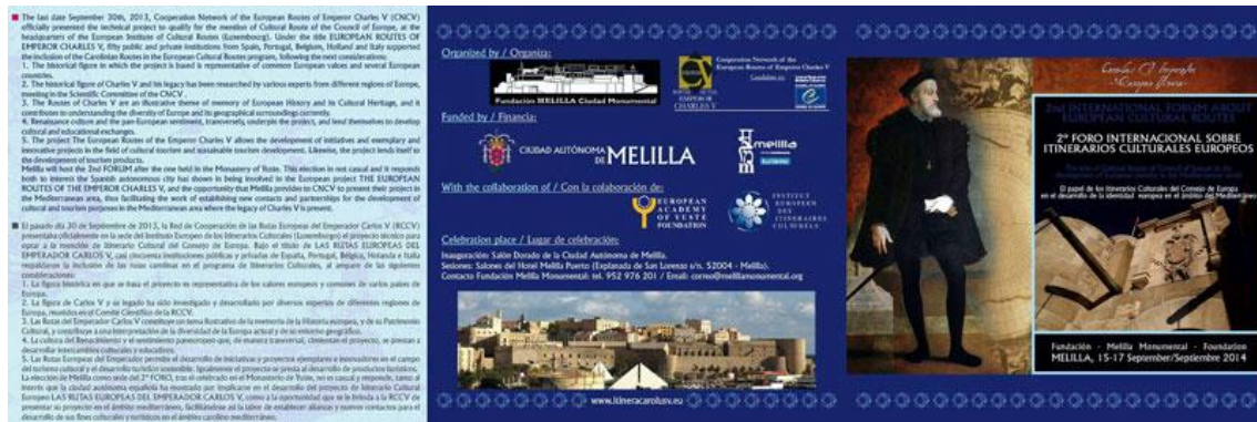
Ilustración 08. “2º Foro Internacional sobre Itinerarios Culturales Europeos”. Tríptico (Fundación Melilla Monumental, 2014).

Sobresale, asimismo, su presencia en foros de patrimonio internacionales, como: la “Red Internacional de Ciudades Europeas de la Cultura” (Tours, 2007) 69 , “Red Internacional Mediterráneo Nostro”, con sede en Sicilia (2007) 70 ; “Red Art Nouveau Network” (2012), “Red AVEC” — Alliance de Ville Européennes de Culture — (2013); “Red de Cooperación de las Rutas Europeas del Emperador Carlos V” (2013) 71 , organizando, en este último caso, el 2º Foro Internacional sobre Itinerarios Culturales Europeos (15-17 septiembre de 2014) [Ilustración 8].