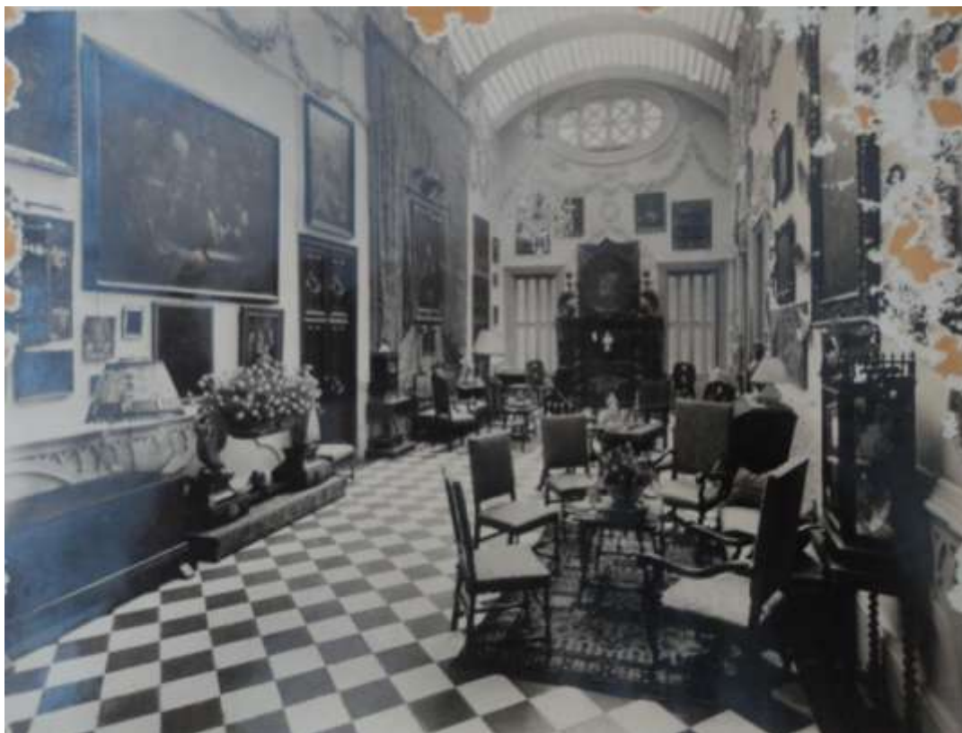
Ilustración 10. Habitación conocida como “La Serre”, palacio de los condes de Berbedel, Valencia.