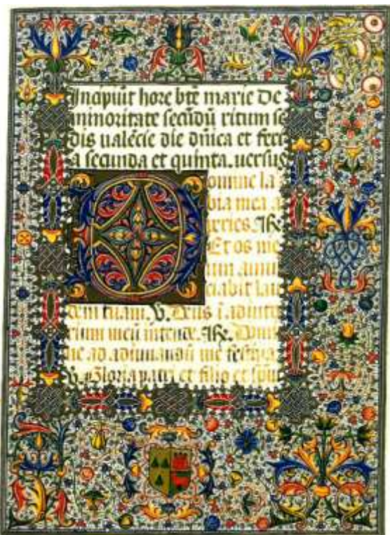
Ilustración 01. Escudo heráldico del Libro de Horas de los marqueses de Dos Aguas. (Santiago, 1993:66)