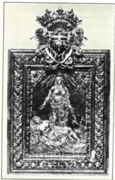
Ilustración 03. Joya de la Piedad, pieza de orfebrería de finales del siglo XVII. (Almunia, 1929:17).

Junto a estas dos joyas que envió como regalo a su hermano, el I marqués, además de enriquecer el patrimonio de la Casa de Dos Aguas, el Gran Maestre de la Orden de Malta también enriqueció el patrimonio eclesiástico valenciano. A la iglesia de San Andrés, donde fue bautizado, 6 hizo donación de un “(...) hermoso terno, una rica alfombra, una lámpara de plata con valor de 800 libras valencianas, una casulla con dalmática y un frontal”, así como también a la Virgen de los Desamparados donó una lámpara de plata de similar valor a la de San Andrés (Almunia, 1929).